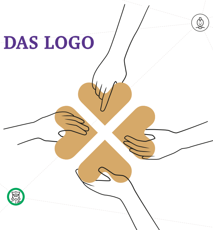
Die vier Blätter symbolisieren die vier beteiligten Interessengruppen. Nur zusammen ergeben sie die Genossenschaft.